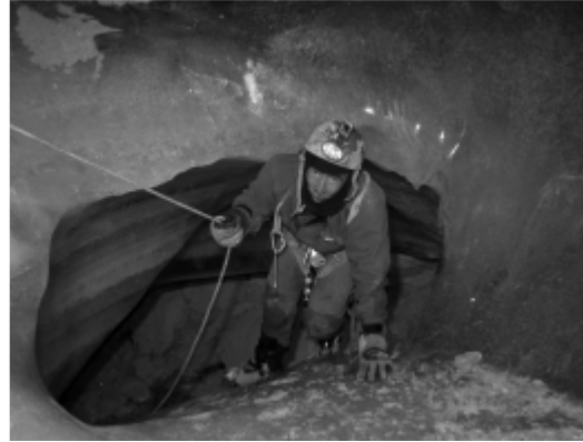
Progression dans une grotte glaciaire

Expérimenté ou pas, quelque soit son age, chacun trouve sa place au sein du club. Le cycle "initiation" permet ainsi de faire découvrir l'activité au plus grand nombre.