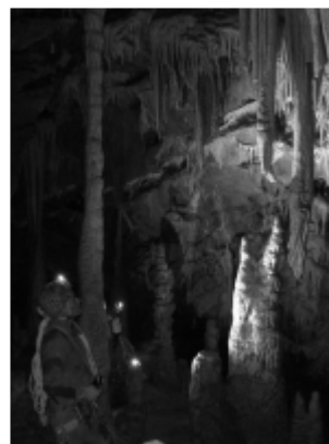
Grotte des merveilleuses, Vercors

Il est possible de s'inscrire à une seule ou à l'ensemble de ces sorties. Contact: voir ci-contre.