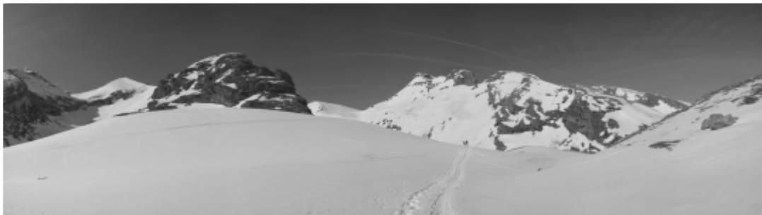
Marche d'approche en hiver