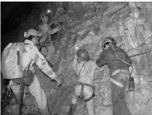
Initiation avec des enfants aux Cuves de Sassenage